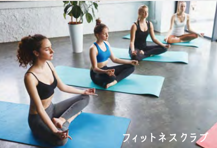
フィットネスクラブ