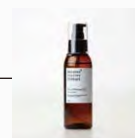
・マッサージオイル