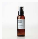
・マッサージオイル