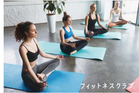
フィットネスクラブ